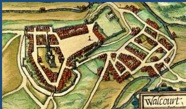
Walcourt - 1567 - L. Guicciardini

❻ Arriverez-vous à apercevoir ces anciennes tourelles et tours fondues dans le décor ?