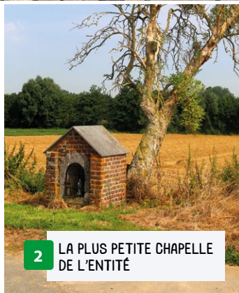
2 LA PLUS PETITE CHAPELLE DE L'ENTITÉ