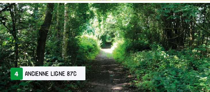
4 ANCIENNE LIGNE 87C