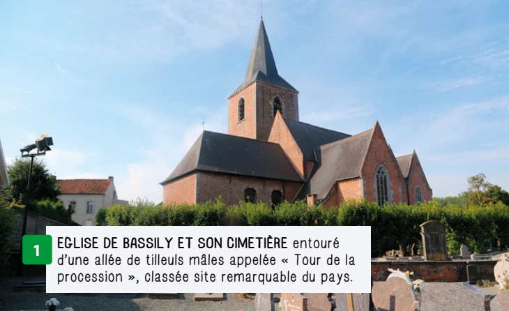
1 EGLISE DE BASSILY ET SON CIMETIÈRE entouré d'une allée de tilleuls mâles appelée « Tour de la procession », classée site remarquable du pays.