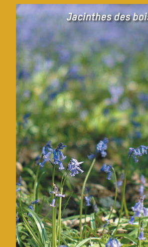
Jacinthes des bois

Quelques dizaines de mètres après le parking, c'est un tout autre Charleroi qui se dévoile avec un visage forestier puis campagnard. Le vallon du ruisseau de la Fontaine-qui-Bout est enchanteur avec ses méandres délicats. On longe une vaste prairie qui comprend un verger et un authentique paysage bocager. On croise une ferme et, en se retournant, on jouit d'un large panorama sur le massif du bois du Prince. En descendant la rue Alexandre, on découvre des maisons insolites aux styles contemporain et organique. On retrouve le bois en longeant des étangs de pêche.