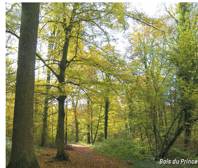
Bois du Prince