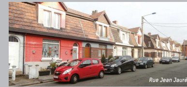
Rue Jean Jaurès

Sur les hauteurs du hameau de la Docherie, imaginez l'ambiance qui régnait dans cet ancien quartier de mineurs des années 1920 aux maisons magnifiquement conservées. GPS N50°42'77" - E4°41'19" Rue Jean Jaurès, 17 - 6030 Marchienne-au-Pont