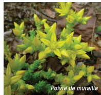
Poivre de muraille