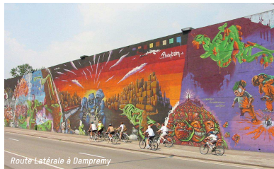
Route Latérale à Dampremy

Avec trois éditions du festival Urban Dream, Charleroi a rejoint, dès 2002, le club des villes européennes ouvertes aux graffeurs. Des centaines d'artistes étrangers ont exécuté des fresques à découvrir le long de la Route Latérale à Dampremy et sur le mur d'enceinte de l'usine Industrielle, face au Rockerill. En 2014, lors du festival « This Land », des graffitis ont été réalisés entre le rond-point de la Route de Mons à Dampremy et le Rockerill. Ne manquez pas les œuvres éclatantes réalisées par les street artists carolos à la rue des Verriers à Marchienne-au-Pont. Depuis 2017, un nouveau mur d'expression libre est ouvert dans le centre de Charleroi à la rue des Rivages.