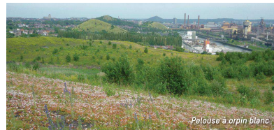
Pelouse à orpin blanc

5 Suivez le sentier vers la gauche qui mène à un creux entre deux terrils. Remontez aussitôt par le sentier le plus à gauche à l'assaut du terrill Saint-Charles . À gauche, vous bénéficiez d'une vue plongeante sur la cité et l'organisation des rues autour de l'église Saint-Pierre de Marchienne-Docherie. Le sentier devient plat, à flanc de coteau. On aperçoit, droit devant, les terrils des Hamendes et du Sacré-Français.