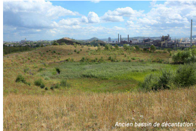
Ancien bassin de décantation

Ce terril est né des extractions du puits Saint-Charles qui se situait au carrefour de la rue Jaumet et de la rue Gantois. Fermé en 1958, ce puits appartenait à la Société Sacré-Madame, comme les sièges des Piges, de la Blanchisserie et Saint-Théodore. Les wagonnets remontés du puits Saint-Charles étaient acheminés vers le triage du Saint-Théodore, dit aussi charbonnage du Bierrau, par un train aérien en béton. Dans les années 90, les deux terrils coniques de Bayemont et Saint-Charles ont été exploités pour leur charbon résiduel puis remodelés en un seul et ensemencés.