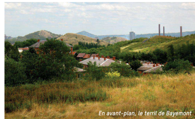
En avant-plan, le terril de Bayemont

Le terril de Bayemont est né des extractions du puits n°18 des charbonnages de Monceau-Fontaine, dit siège Parent, ou encore puits Providence. Il se situait à la rue des Réunis à Marchienne-au-Pont, à proximité d'une cokerie et le long du canal. Les deux premiers puits de ce charbonnage ont été creusés en 1844, le troisième en 1930. Son nom vient d'un certain Pierre-Joseph Parent, un homme d'affaires marchiennois qui avait acheté des bois à La Docherie pour y ériger des cités ouvrières. La profondeur des puits atteint 1.291 m. La particularité du siège est qu'il possédait trois chevalements, dont le plus grand a été érigé en 1930. Le 15 avril 1940, il fut le théâtre d'un coup de grisou qui fit 26 morts. On le voit apparaître dans le film « L'Étoile du Nord » (1982) et il sert de décor principal au film « Le Brasier » (1989). Fermé le 31 mars 1978, le charbonnage a été rasé en 1991. Les terrains appartiennent aujourd'hui au groupe Duferco dont la friche est en voie de reconversion.