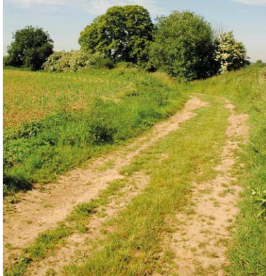
5 HET GEHUUCHT « MONT AU GRIS » Het gehucht Mont au Gris zou zijn naam te danken hebben aan een kloostergemeenschap die hier ooit woonde en waarvan de zusters “een grijze mantel” droegen, of aan grijze vogels die hier samenkwamen.