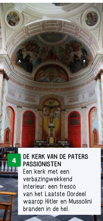
4 DE KERK VAN DE PATERS PASSIONISTEN Een kerk met een verbazingwekkend interieur: een fresco van het Laatste Oordeel waarop Hitler en Mussolini branden in de hel.