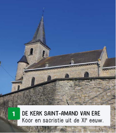
1 DE KERK SAINT-AMAND VAN ERE Koor en sacristie uit de XI e eeuw.