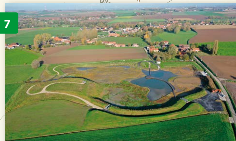
WATERBERGINGSGBIED VAN MALADRERIE