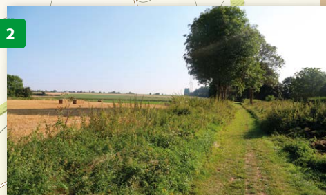
DE OUDE SPOORLIJN 88A DOORNIK-RUMES-ORCHIES

KERK SAINT-GÉRY VAN WILLEMEAU De klokkentoren van deze neoromaanse kerk, gebouwd tussen 1859 en 1863, zou de vijf torens van de kathedraal van Doornik symboliseren.