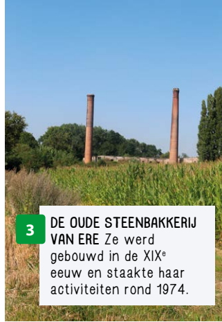
3 DE OUDE STEENBAKERIJ VAN ERE Ze werd gebouwd in de XIX e eeuw en staakte haar activiteiten rond 1974.