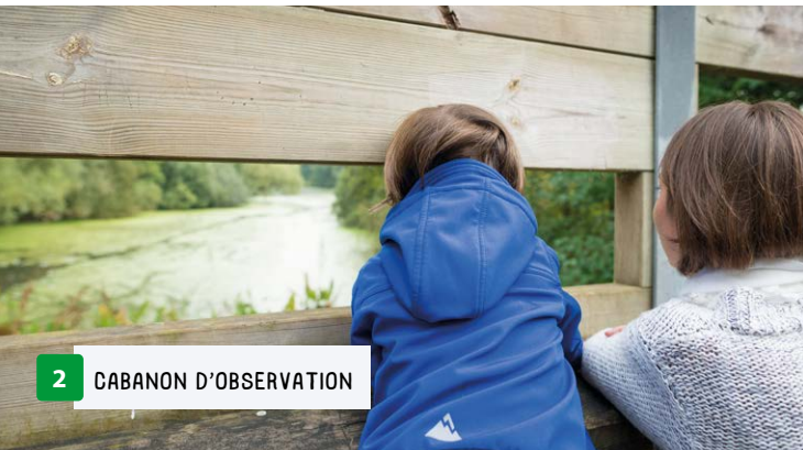
2 CABANON D'OBSERVATION