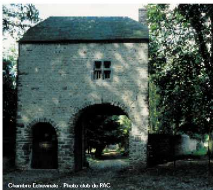
Chambre Echevinale

consacrée en 1237 et restaurée en 1978) (visite sur demande). Notre chemin se continue par un sentier qui nous amène à la Fontaine Notre-Dame qui y coule depuis des siècles. Jadis, on lui attribuait des vertus thérapeutiques... Ces lieux sont très animés lors de la procession de Notre-Dame du Roux qui se déroule chaque année au 15 août. Cette procession est née pour conjurer les épidémies de peste ou de lépre et obtenir de bonnes récoltes.