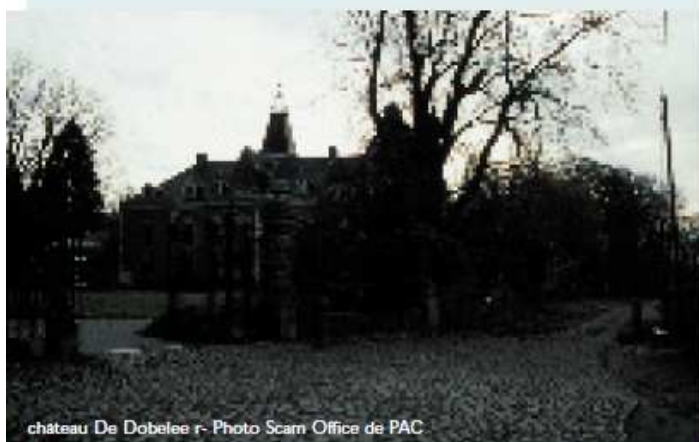
château De Dobelee r- Photo Scam Office de PAC

Empruntons la rue Loriaux à gauche et dirigeons-nous par le chemin de l'Encloître vers la Chambre Echevinale , récemment restaurée. Porte nord de la Ferme de l'Encloître devenue ensuite Chambre de Justice, elle daterait du XIIe. Des expositions de nos artistes locaux et d'ailleurs font vivre ce monument classé.