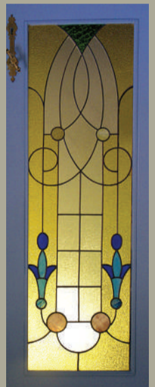
HET GULDEN HUIS rue Tumelaire, 15