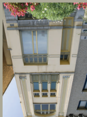
LA MAISON LAFLÉUR boulevard Solvay, 7

De inspiratie die uit de plantenwereld werd gehaald, is hier op een gestileerde manier aanwezig. Zo getuigen de fries onder de kroonlijst, de glas-in-loodramen van de wintertuin of de elegante gebogen lijnen van het praktische houten raamwerk en van het stiersmeedwerk van de kennis van de ambachtssleden.