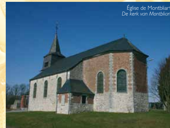
Église de Montbliart De kerk van Montbliart

5. La Chapelle , édifée en 1681, est en pierre bleue locale. Sa niche est en marbre de Rance. Elle a été restaurée en 1992 par les élèves de l'Institut Technique de Rance.