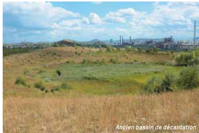
Ancien bassin de décantation

Ce terril est né des extractions du puits Saint-Charles qui se situait au carrefour de la rue Jaumet et de la rue Gantois. Fermé en 1958, ce puits appartenait à la Société Sacré-Madame, comme les sièges des Piges, de la Blanchisserie et Saint-Théodore. Les wagonnets remontés du puits Saint-Charles étaient acheminés vers le triage du Saint-Théodore, dit aussi charbonnage du Bierrau, par un train aérien en béton. Dans les années 90, les deux terrils coniques de Bayemont et Saint-Charles ont été exploités pour leur charbon résiduel puis remodelés en un seul et ensemençés.