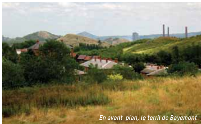
En avant-plan, le terril de Bayemont

Le terril de Bayemont est né des extractions du puits n°18 des charbonnages de Monceau-Fontaine, dit siège Parent, ou encore puits Providence. Il se situait à la rue des Réunis à Marchienne-au-Pont, à proximité d'une cokerie et le long du canal. Les deux premiers puits de ce charbonnage ont été creusés en 1844, le troisième en 1930. Son nom vient d'un certain Pierre-Joseph Parent, un homme d'affaires marchiennois qui avait acheté des bois à La Docherie pour y ériger des cités ouvrières. La profondeur des puits atteint 1.291 m. La particularité du siège est qu'il possédait trois chevalements, dont le plus grand a été érigé en 1930. Le 15 avril 1940, il fut le théâtre d'un coup de grisou qui fit 26 morts. On le voit apparaître dans le film « L'Étoile du Nord » (1982) et il sert de décor principal au film « Le Brasier » (1989). Fermé le 31 mars 1978, le charbonnage a été rasé en 1991. Les terrains appartiennent aujourd'hui au groupe Dufenco dont la friche est en voie de reconversion.