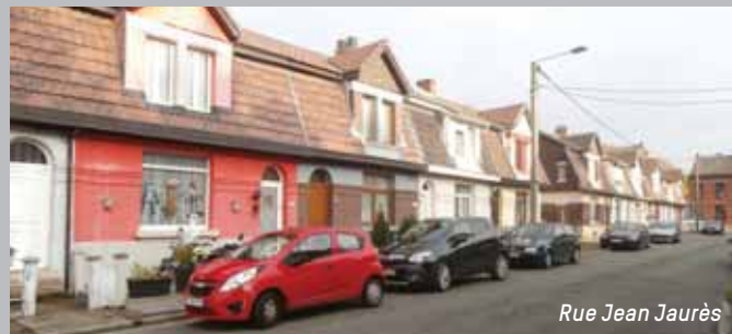
Rue Jean Jaurès

Ce centre culturel très insolite est installé dans les anciennes forges de la Providence qui ont appartenu à Cockerill-Sambre, puis à Carsid-Duferco. En 2005, un collectif d'artistes récupère les lieux et les rebaptise Rockerill. La façade se distingue par un gigantesque disque vinyle peint sur fond orange. Les forges, conservées dans l'état d'origine, font du Rockerill le lieu de la culture alternative du Pays de Charleroi. Ses « apéros industriels » du jeudi soir et autres soirées électroniques sont des rendez-vous incontournables. Rue de la Providence, 136 - 6030 Marchienne-au-Pont www.rockerill.be