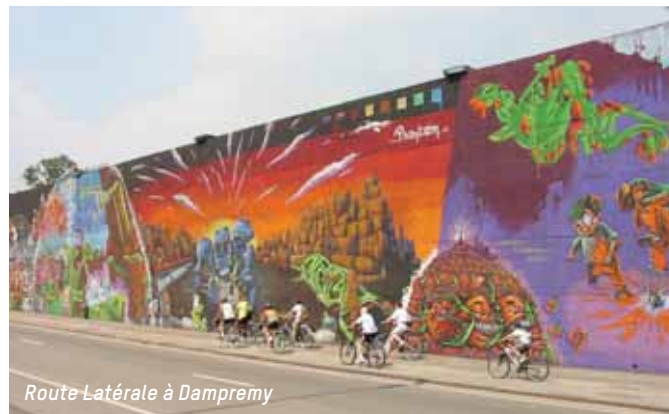
Route Latérale à Dampremy

Avec trois éditions du festival Urban Dream, Charleroi a rejoint, dès 2002, le club des villes européennes ouvertes aux graffeurs. Des centaines d'artistes étrangers ont exécuté des fresques à découvrir le long de la Route Latérale à Dampremy et sur le mur d'enceinte de l'usine Industeel, face au Rockerill. En 2014, lors du festival « This Land », des graffitis ont été réalisés entre le rond-point de la Route de Mons à Dampremy et le Rockerill. Ne manquez pas les oeuvres éclatantes réalisées par les street artists carolos à la rue des Verriers à Marchienne-au-Pont. Depuis 2017, un nouveau mur d'expression libre est ouvert dans le centre de Charleroi à la rue des Rivages.