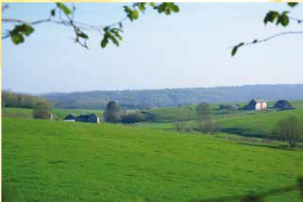
Ferme de l'Ermitage De Boerderij van de afgezonderde plek

Aan de Chemin des 15 Pieds, slaat u rechtsaf om terug te keren naar uw vertrekpunt.