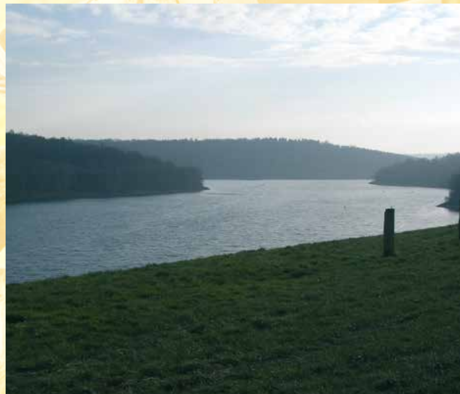
Vue sur le lac de l'Eau d'Heure du Belvédère - Zicht op het meer van l'Eau d'Heure vanaf de panoramatoren

Avant de retourner vers le village, et pour clôturer cette promenade en beauté, profitez de votre passage devant la Ruchette (5) pour y déguster un petit verre d'Hydromel.