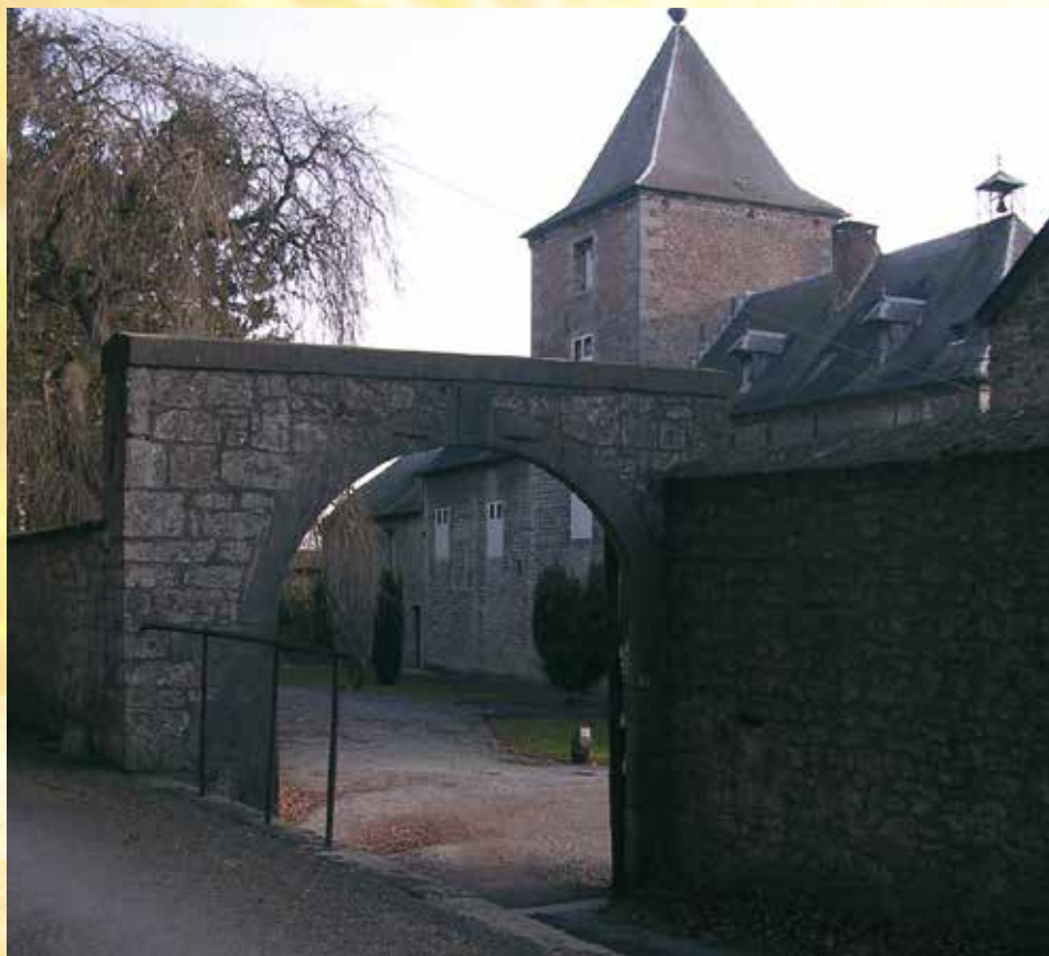
Château-Ferme de Boussu-lez-Walcourt - Kasteel-boerderij van Boussu-lez-Walcourt

Vooraleer terug te keren naar het dorp en om in schoonheid af te sluiten, zou u een glaasje Hydromel kunnen proeven wanneer u voorbij la Ruchette (5) passeert.