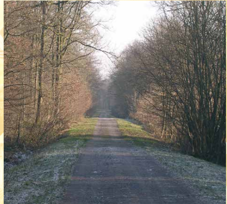
Chemin Mélanie - Bois des Hamaides - "Chemin Mélanie" - Bos van "Les Hamaides"

C'est une magnifique promenade qui vous propose des vues très diverses de nos campagnes, forêts et sites touristiques.