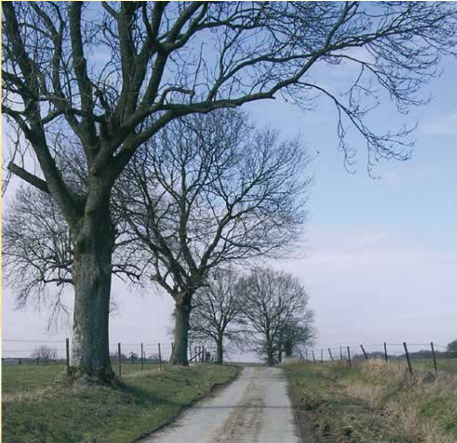
Vue sur le centre de Froidchapelle de la rue Fosse au Sable - Zicht op het centrum van Froidchapelle vanaf de "rue Fosse au Sable"

Dit is een prachtige tocht die u uitzicht biedt op gevarieerde landschappen, bossen en het toeristische domein.