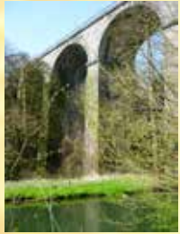
Le viaduc de l'Eau Blanche Het viaduct van l'Eau Blanche