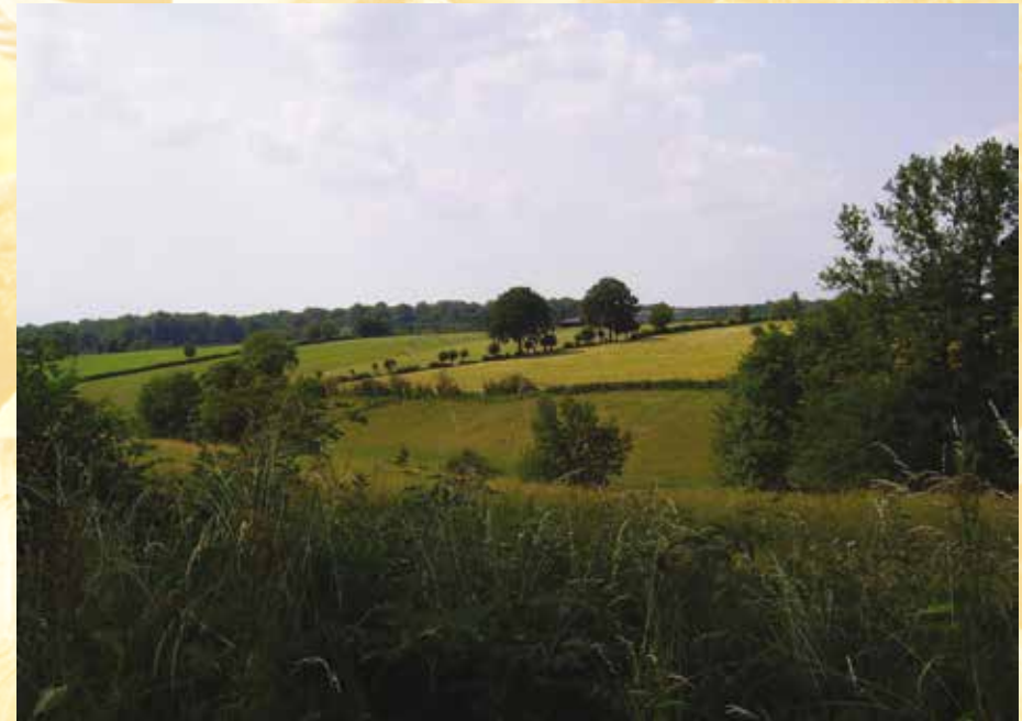
Vue sur le Nouveau Monde / Zicht op 'Le Nouveau Monde' Monde"

Entre le village de Macquenoise et la rivière, le cercle archéologique de la Thiérache a mis à jour les fondations d'un bâtiment de thermes gallo-romains ainsi qu'un cimetière romain avec des tombes à incinération et de nombreux fragments d'objets datés du II e s.