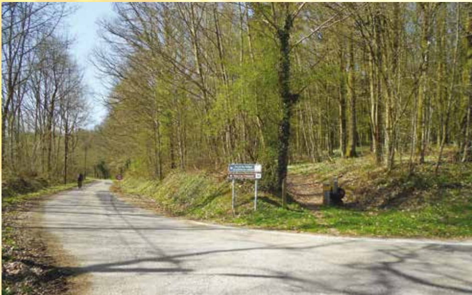
Bois de la Masure / Bos van « la Masure »

In de gemeente zijn tal van prehistorische overblijfselen ontdekt. Op de plaats die men le Fourmatot noemt, vond men sporen van een glasblazerij. Langs het riviertje Fourmatot werden ook glasscherven uit de 2 e eeuw teruggevonden. De glasoven die in het begin van de 12 e eeuw in gebruik werd genomen, bleef actief tot rond 1780. Tussen het dorp Macquenoise en de rivier heeft het archeologische genootschap van de Thiérache de fundamenten blootgelegd van Gallo-Romeinse thermen en een Romeinse begraafplaats met crematiegraven en tal van voorwerpen uit de 2 e eeuw.