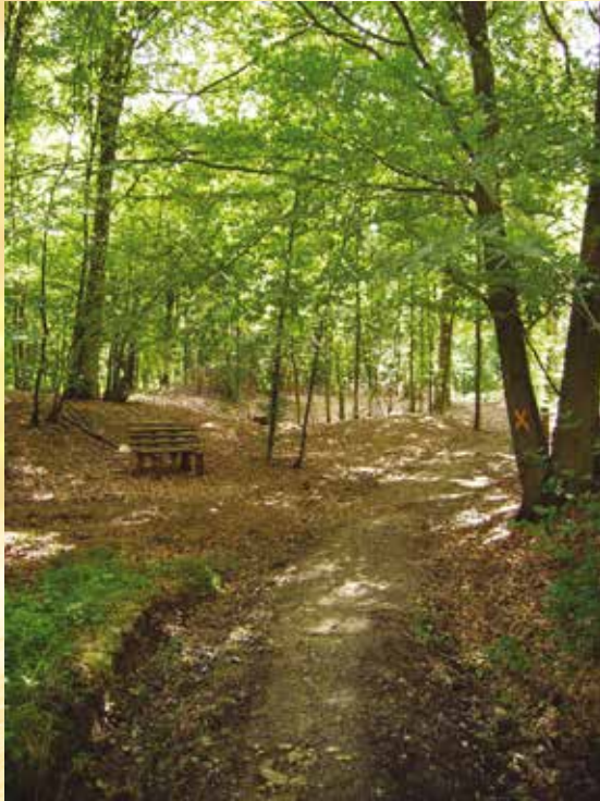
Près du lavoir de Seloignes Dichtbij de wasbak van Seloignes

De activiteit van de klompenmakers kwam sterk in de verdrukking toen de klompenmakerij van Villers-la-Tour gemechaniseerd werd.