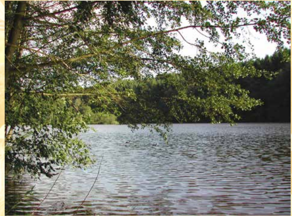
Fourneau d'Oise / Fourneau d'Oise

L'activité des sabotiers diminua fortement avec la mécanisation de la saboterie de Villers-la-Tour.