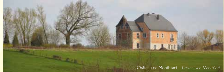
Château de Montbliart – Kasteel van Montbliart

2. Le « Château » était au 17e siècle l'habitation d'un Maître de Forge. La tour carrée a été construite au 18e siècle. Le bâtiment servit de refuge aux habitants de Montbliart lors de nombreuses invasions. Il fut par la suite transformé en ferme au 19e siècle.